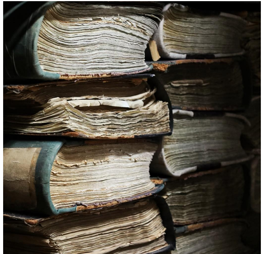
Na zdjęciu stare książki w magazynie