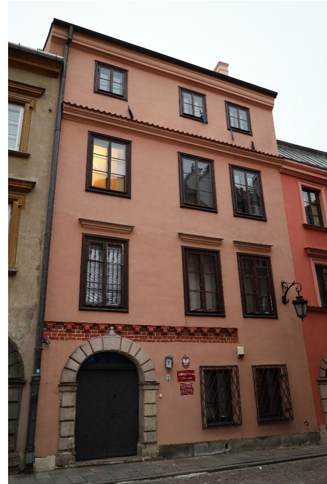
Na zdjęciu budynek Archiwum

Archiwum Państwowe w Warszawie to miejsce, gdzie trzyma się różne archiwa. Takie jak stare dokumenty, mapy, fotografie. Pochodzą one z obszaru Warszawy i Mazowsza. Budynek Archiwum znajduje się na ulicy Krzywe Koło 7. To zabytkowa kamienica na starówce.