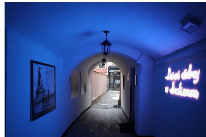
Na zdjęciu korytarz, z którego trzeba wejść w pierwsze drzwi w prawo

Potem trzeba iść korytarzem i skręcić w prawo, gdzie są drzwi.