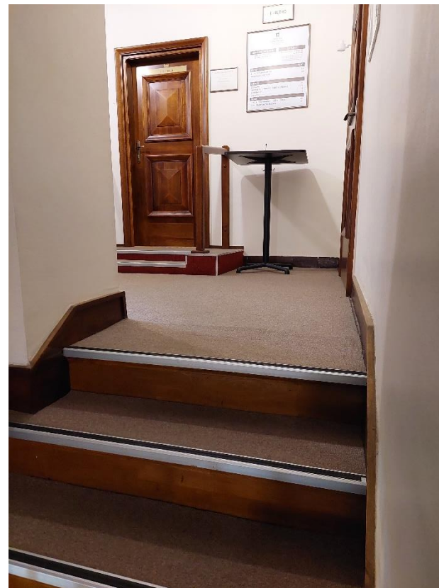
Na zdjęciu schody do Biura Obsługi Klienta

Do Biura Obsługi Klienta trzeba podejść schodkami na pierwsze piętro. Jeszcze piętro wyżej jest Czytelnia.