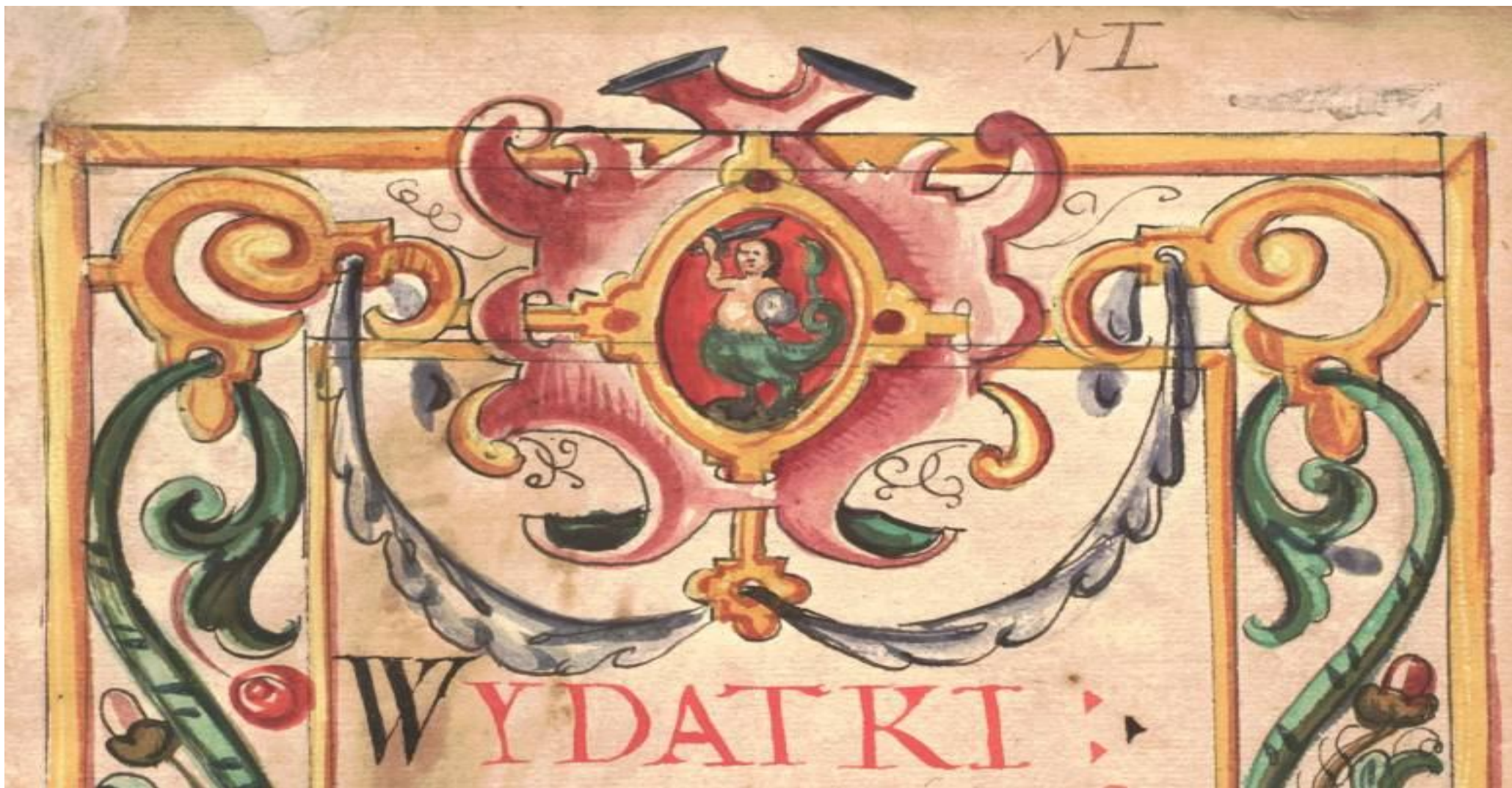
Księga rachunkowa miasta Starej Warszawy, 1609, kolorowy rysunek na karcie tytułowej, Warszawa Ekonomiczne, sygn. 227 (AGAD)