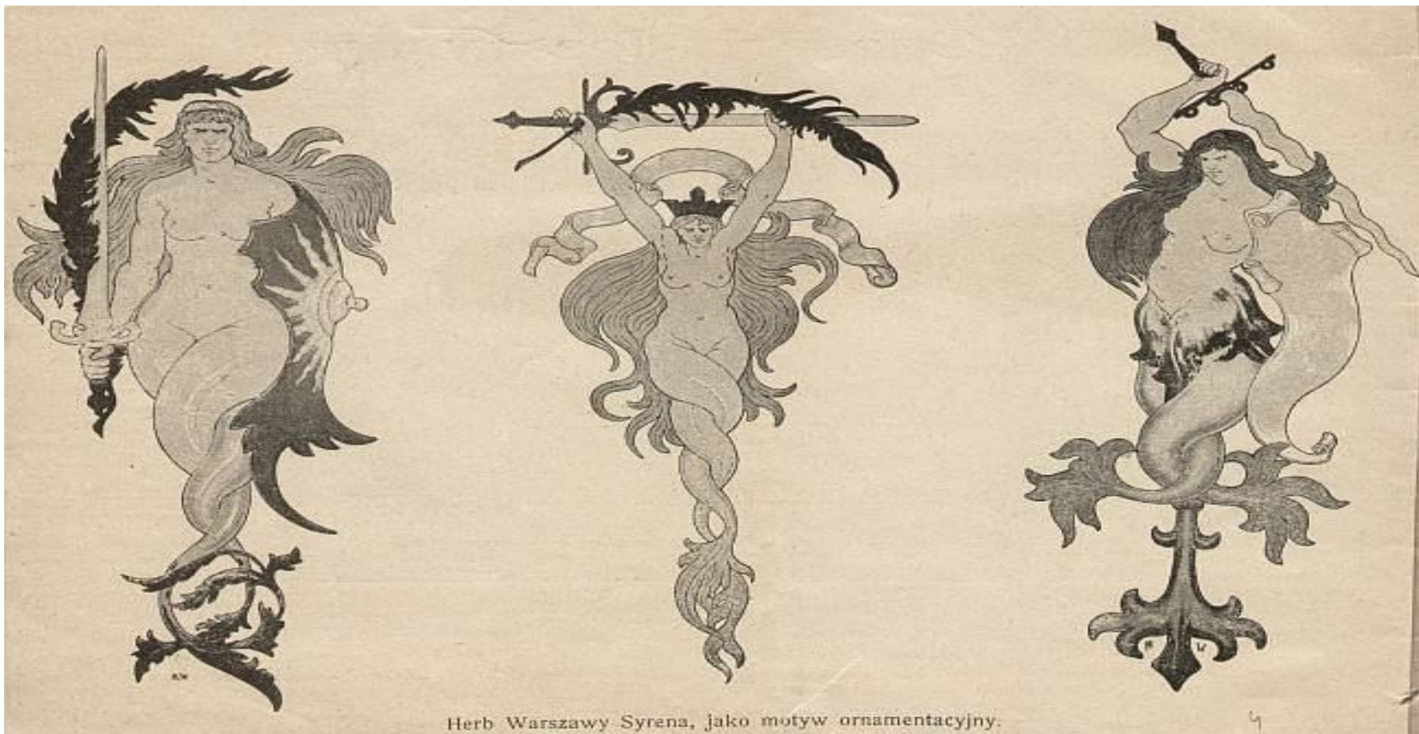
Herb Warszawy Syrena, jako motyw ornamentacyjny.

Ornament wg projektu Maryana Wawrzeckiego, artykuł opublikowany w „Tygodniku Ilustrowanym” 1900, nr 34, Zbiór Korotyńskich, sygn. IV/5—korot IV/V 6 (APW)