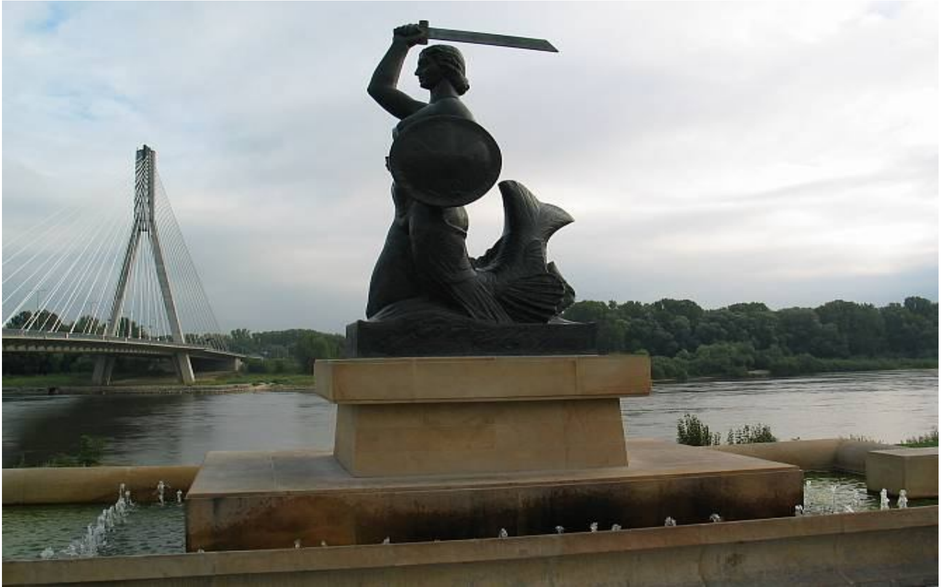
Pomnik Syreny znad Wisły z 1939 r. dłuta Ludwiki Kraskowskiej-Nitschowej