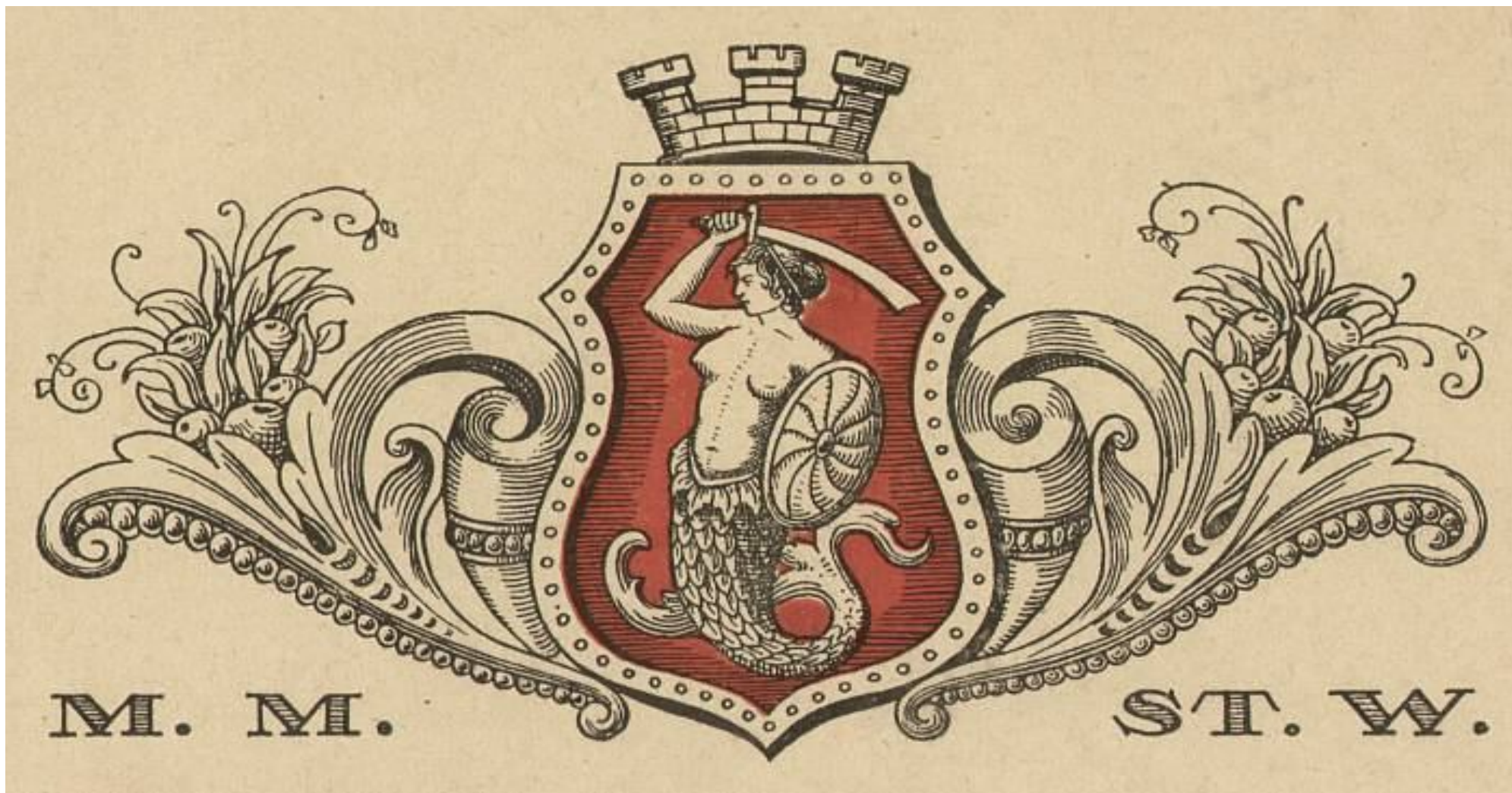
Karta żywnościowa, Akta miasta Warszawy inne, I. Karty żywnościowe 1914–1921, s 1, sygn. 1961 D 111 (APW)