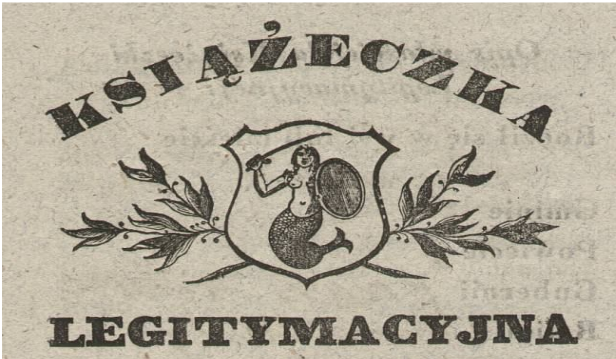
Książeczka legitymacyjna, 1845, Kancelaria Teofila Brzozowskiego notariusza w Warszawie, 1842–1876, (APW)