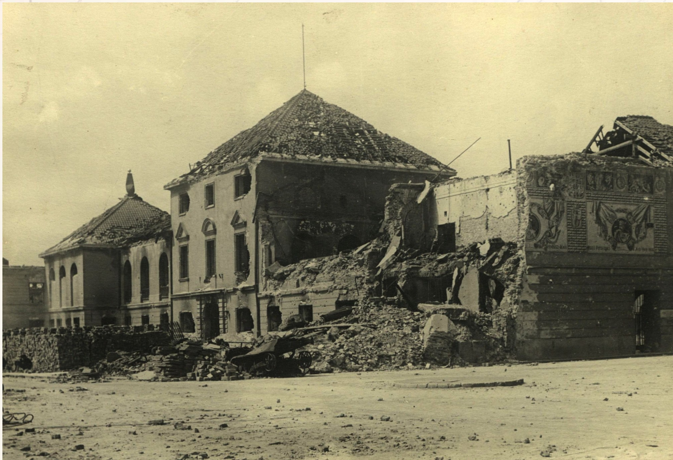
1945 r.

Состояние в городе Радзивилов: после второго (рекурсивного) дня